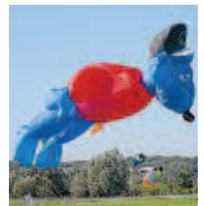
Sehr beliebt: Luftsäcke, die prominente Figuren formen.