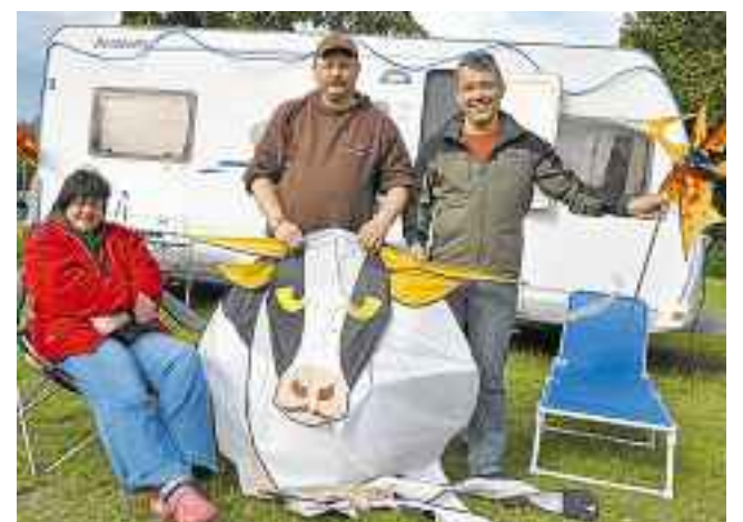
Im Camp diesseits des Deiches war die Stimmung trotz des Wetters meistens gut.