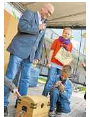
Wer hat nur den Schlüssel für die Ferienkiste?