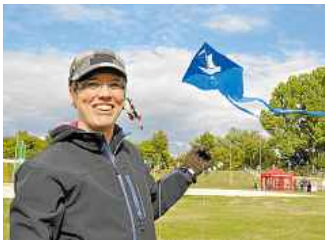
Eine Pünte am Ems-Ufer ist ja nicht so ungewöhnlich, eine fliegende allerdings schon.

Mehr Bilder zum Thema in den Fotogalerien auf www.wn.de