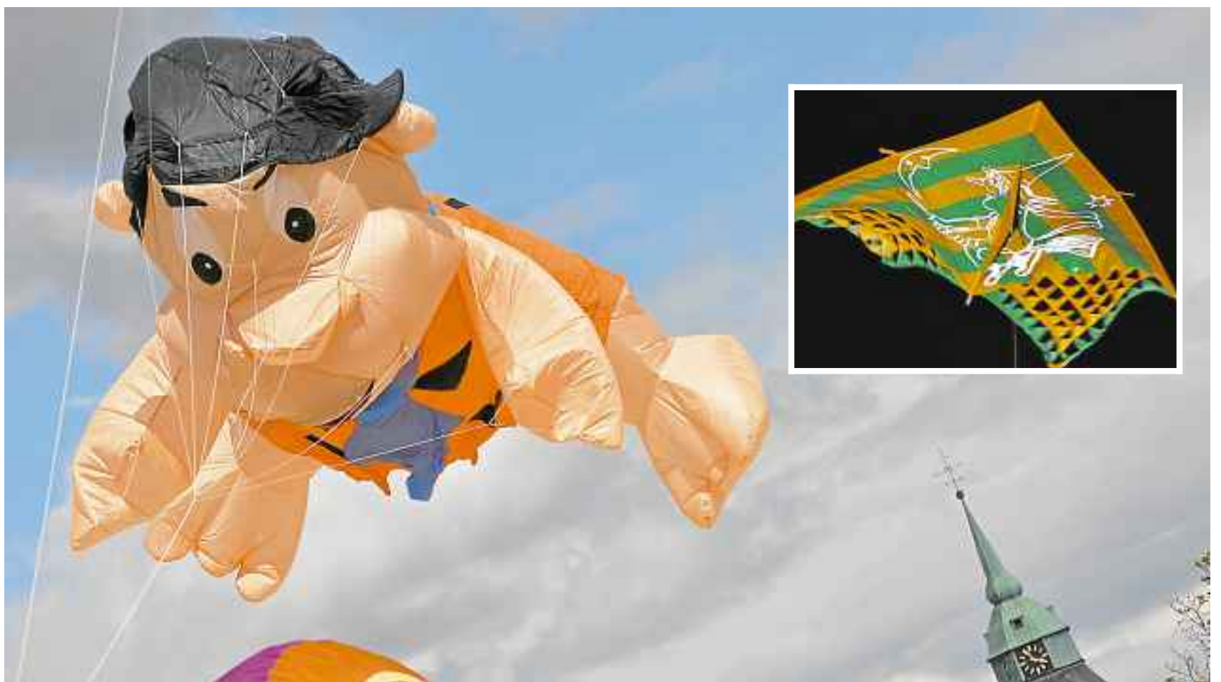
Da war allerhand los am Grevener Himmel - vor allem am Samstag, als das Wetter zumindest stundenweise ein Einsehen hatte. Besonders spektakuläre Bilder bekamen die Besucher der Nachflugshow zu sehen.