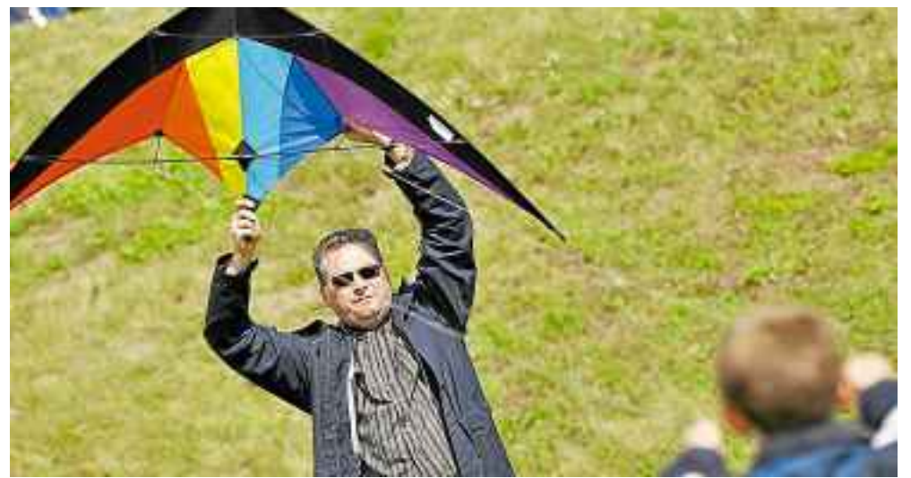
Eine Veranstaltung für die ganze Familie: Hier versuchen Papa und Sohnemann mit vereinten Kräften, den Drachen Richtung Himmel zu bewegen.