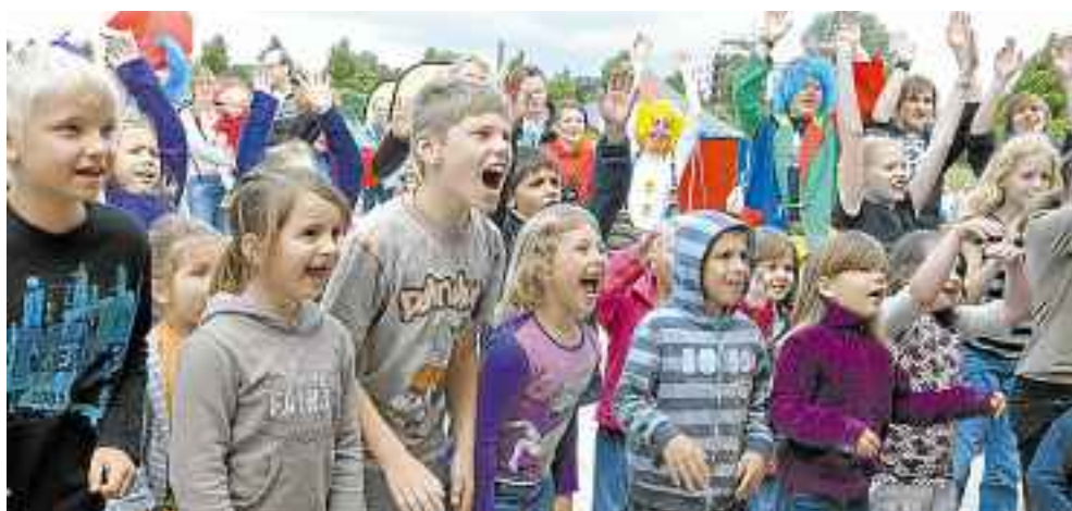
Die Kinder konnten es kaum abwarten. Sie wussten: Zum Start der Ferienkiste gibt es stets Süßigkeiten.