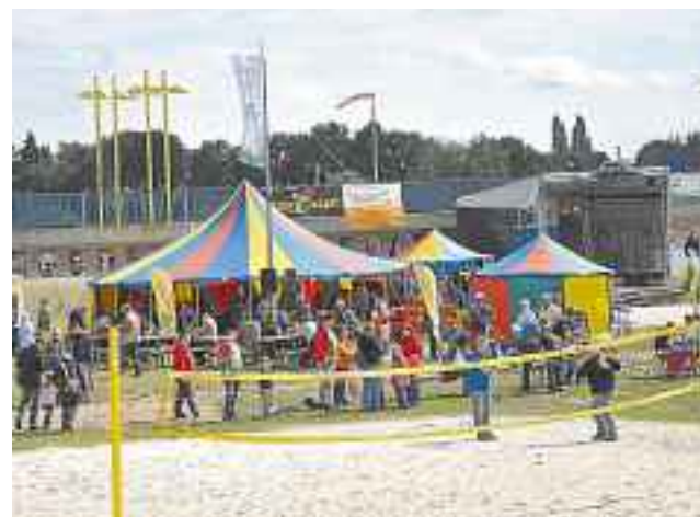
Als sich am Samstag die Sonne blicken ließ, war der Beach gut besucht.